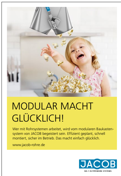
Anzeige für Fachzeitschriften